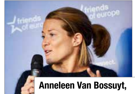
Anneleen Van Bossuyt, Europees Parlements lid N-VA

Met het tienpuntenplan wil Van Bossuyt een einde maken aan de vele gemiste opportuniteiten, door o.a. te zorgen voor lagere lasten, een groter budget en een strengere selectie om zo de uiteindelijke slaagkansen te verhogen.