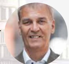
Andries Gryffroy Vlaams Parlementslid

De coronapandemie hakte de voorbije maanden hard in op het verenigingsleven. De Vlaamse Regering heeft daarom 84 miljoen euro extra vrijgemaakt voor de cultuur-, jeugd- en sportverenigingen in alle Vlaamse gemeenten. Zo'n 130.000 euro van dat bedrag gaat naar onze gemeente.